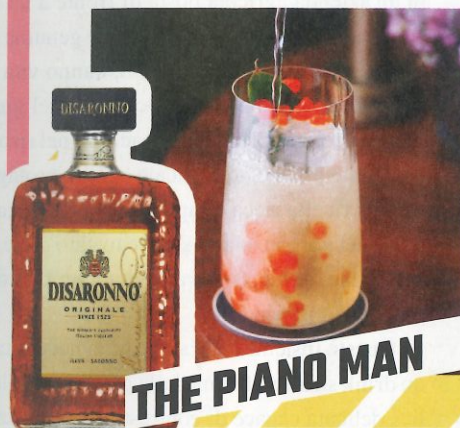
THE PIANO MAN

HEAD BARTENDER DELL'ATRIUM BAR DI FIRENZE, VINCITORE AI BARAWARDS, GUIDA UN TEAM DI 10 PERSONE